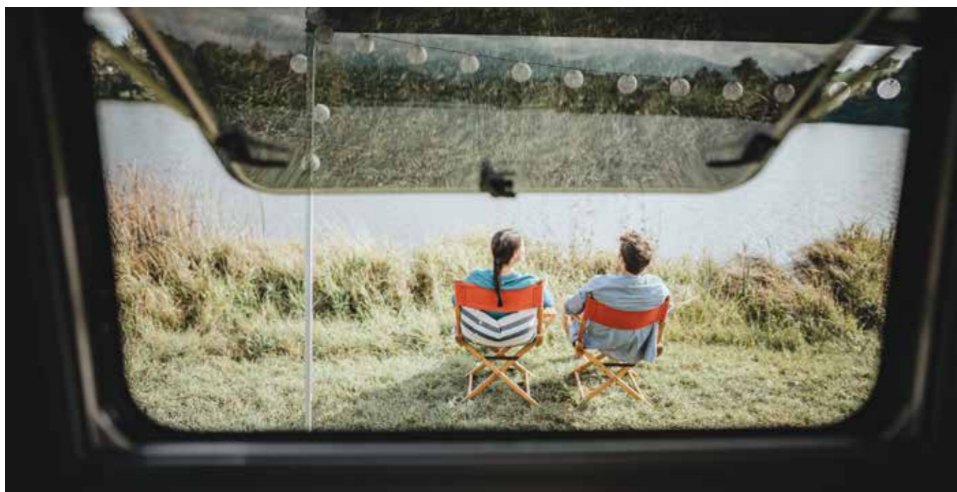
Nesselwang čas za počitek ob Schwaltenweiher (Allgäu)