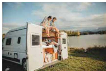
Nesselwang kampiranje ob Schwaltenweiher (Allgäu)

Vseeno pa je zanimiv podatek, da bi večina Nemcev, starih od 22 do 39 let, na počitnicah raje kampirala kot koristila ponudbo all inclusive. To pa zato, ker želijo počitnikarji v tej starostni skupini na počitnicah čim več doživeti. Ta trend opazno narašča zlasti od leta 2015.