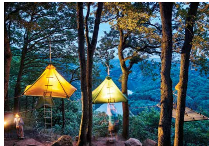
Mettlach: nočitev v bivaku portaledge s pogledom na rečni okljuk Saarschleife