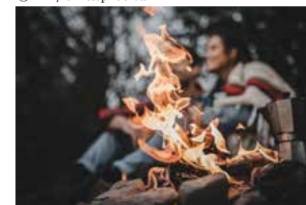
Forggensee: sproščanje ob odprtem ognju na prostem

Supported by: Federal Ministry for Economic Affairs and Climate Action on the basis of a decision by the German Bundestag