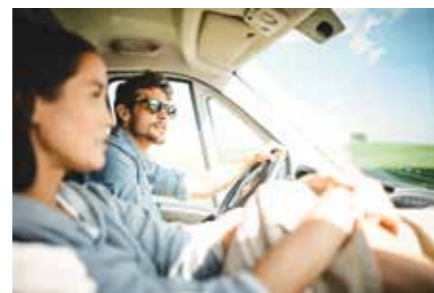
Nesselwang na poti do Schwaltenweiher (Allgäu)