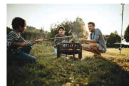
Nesselwang peka klobas nad ognjem na prostoru za kampiranje ob Schwaltenweiher (Allgäu)