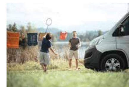
Nesselwang igranje badmintona ob Schwaltenweiher (Allgäu)