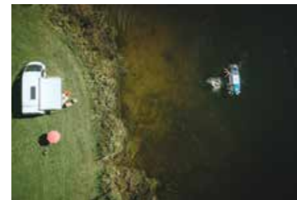
Nesselwang: supanje na jezeru ob Schwaltenweiher (Allgäu)

Za tiste, ki se vam kuhati ne ljubi ali pa bi radi poskusili kakšno novo jed, pa je v vsakem kampu odprta kakšna gostilnica ali pivnica. Tam ne sme manjkati domačih dobrot in sveže točenega piva.