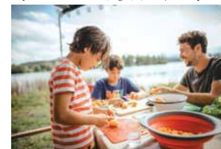
Nesselwang priprava kosila ob Schwaltenweiher (Allgäu)