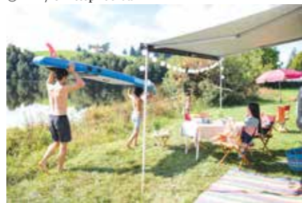
Družina s supom ob ribniku Schwaltenweiher (Allgäu)