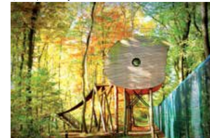
Baumhaushotel Tree Inn