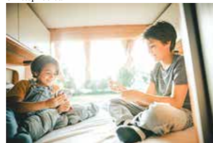
Nesselwang igranje kart ob Schwaltenweiher (Allgäu)