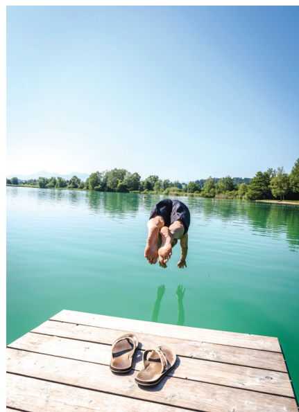
Taching am See: kopanje v jezeru