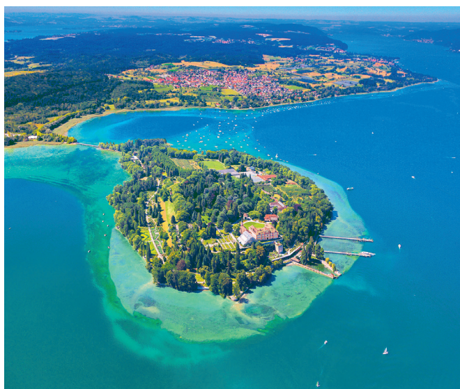
Konstanz otok Mainau