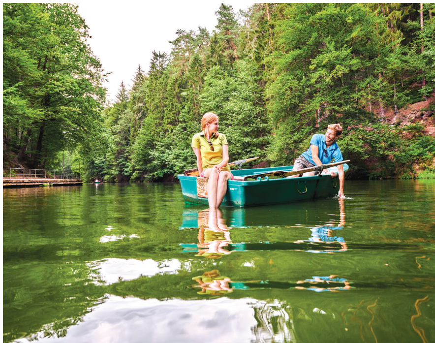
Saška Švica: vožnja s čolnom na jezeru v narodnem parku

Če se odločite za obisk Bodenskega jezera, boste uživali ne le v osvežilnem kopanju, ampak tudi v čudoviti gorski panorami. Na jasen dan boste na sinjem modrem nebu v daljavi videli Appenzelske Alpe. Bodensko jezero, ki leži na samem jugu Nemčije, skriva polno malho presenečenj, naravnih lepot in kulturnih znamenitosti. Jezero se ponša s številnimi plažami in kopališči za vse okuse. Če vas zanima, kako so se kopali pred 100 leti, obiščite kopalnišče Mili Bregenz. Izvrstna izbira je tudi kopalnišče Strandbad West v Überlingnu z razgledom na Alpe in otokom. Lastno kopalnišče pa ima tudi otok Reichenau. Največje vodno telo v Nemčiji je tako pravi raj za ljubitelje kopanja, kulture in naravnih lepot.