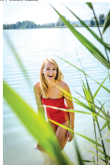
Taching am See: kopanje v jezeru