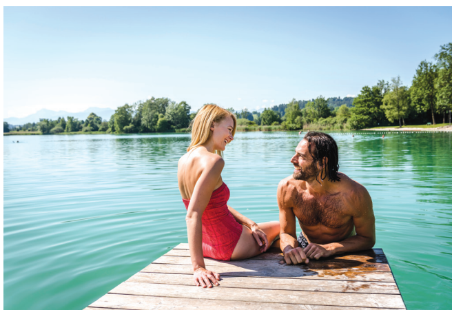
Taching am See: kopanje v jezeru

Od skupno 12.000 naravnih kopalnih jezer v Nemčiji jih na vaš obisk čaka vsaj 2.000. Ta jezera niso le izvrstne izletniške točke, ampak imajo tudi odlično kakovost vode, ki jo preverjajo na nemškem ministrstvu za okolje. Jezera tako dajejo življenjski prostor številnim živalim, ljudem pa kraj za sprostitvev.