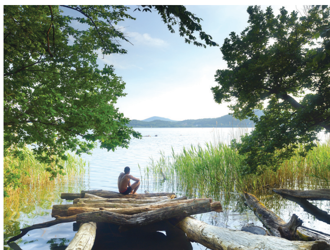
Glees: Sprostitev v naravnem rezervatu jezera Laacher See v Vulkaneifelu

Že nekajkrat smo vas na teh straneh opozorili, da so del Nemčije, pokrajino Eifel, nekoč, pred mnogimi tisočletji, pokrivali ognjeniki. Danes so ti konci mnogo prijaznejši, »polni« kraterskih jezerc. Eno izmed jezerc je letoviški Laacher See s kristalno čisto, ledeno mrzlo vodo, ki je največje jezero v zvezni deželi Porenje -Pfalz. Ravno nastanku v ognjeniškem kraterju se zahvali za skorajda popolno okroglo obliko. Okolica ponuja obilo možnosti za pohodništvo in kolesarjenje, v bližini jezera pa stoji samostan Maria Laach. Na obali jezera je urejen tudi kamp.