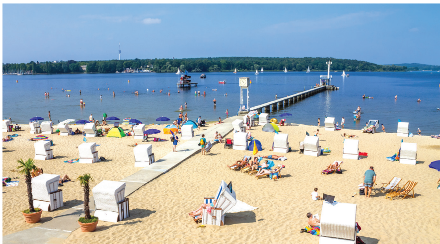
Berlin: Lido v parku Großer Wannsee

Poleti je na obalah jezera vse polno prebivalcev bližnjih Berlina in Potsdama, ki na jezerski obali (in vodi) iščejo osvežitev. Podjetni Nemci so za ureditev plaž pripeljali celo pesek s plaž slovitega baltiškega letovišča Travemünde, vstop na urejeno plažo pa stane 5,5 evra po osebi. Urejen je tudi »kotiček« za naturiste.