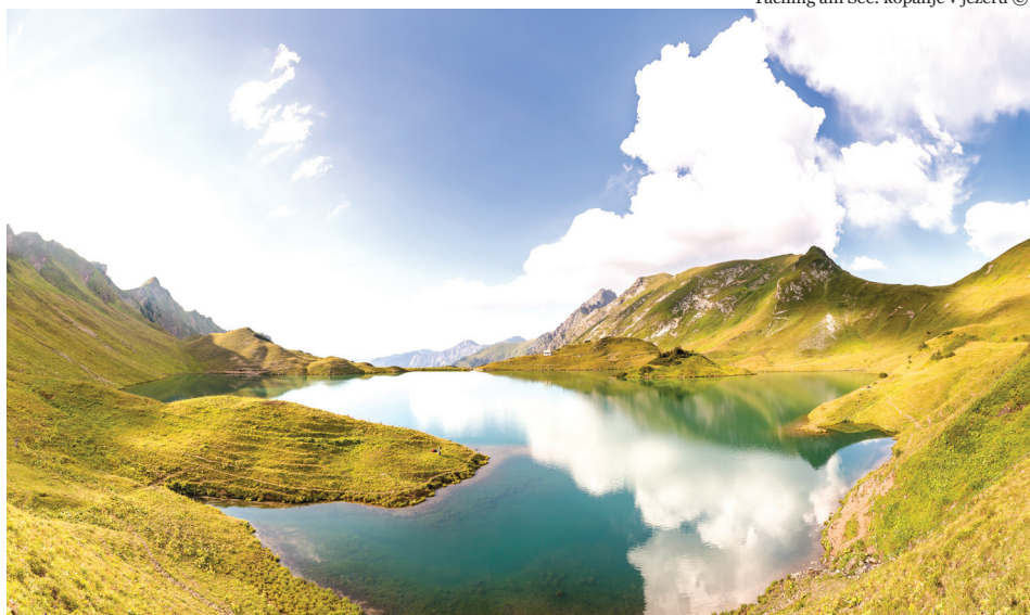
Bad Hindelang alpsko jezero Schrecksee v Allgäu