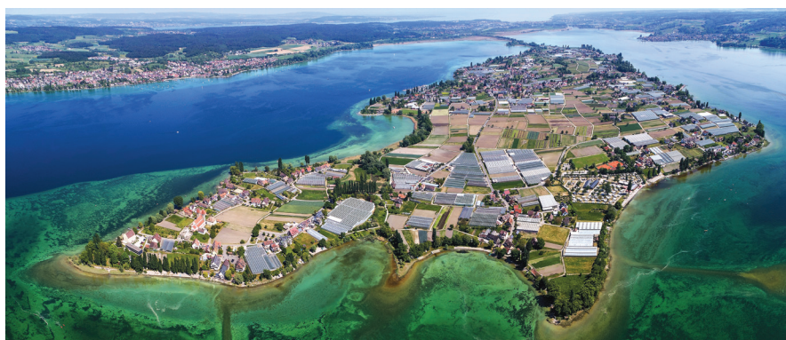
Bodensko jezero: otok Reichenau (UNESCO-va kulturna dediščina)