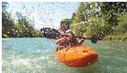
Oberstdorf: vožnja s kajakom v Oberallgäu