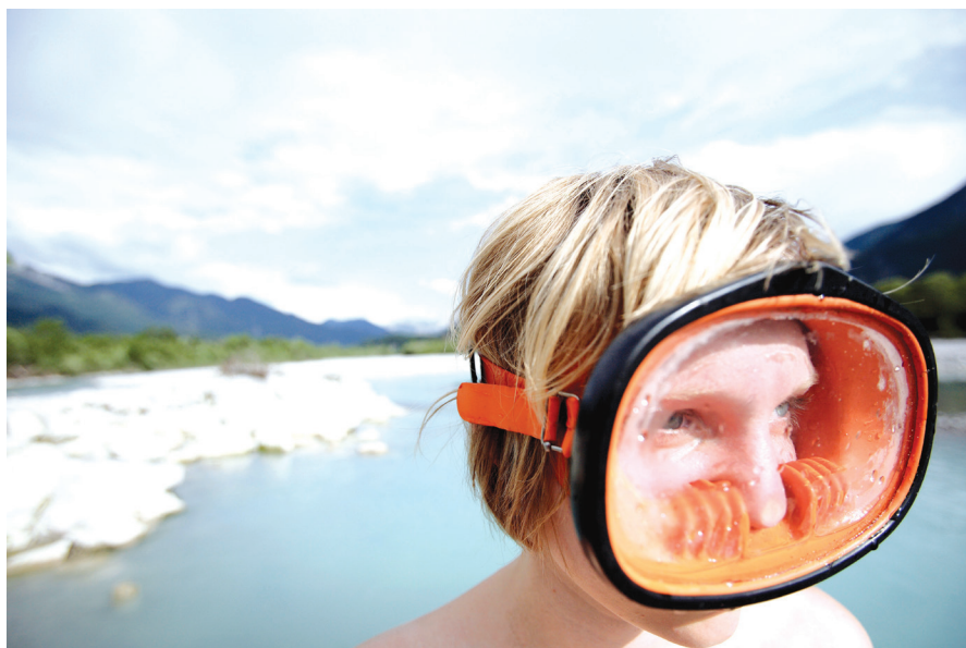
Füssen: snorkljanje