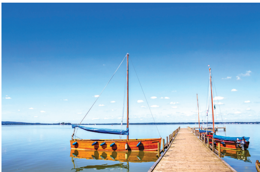
Pogled na morje Steinhuder Meer in privezane jadrnice