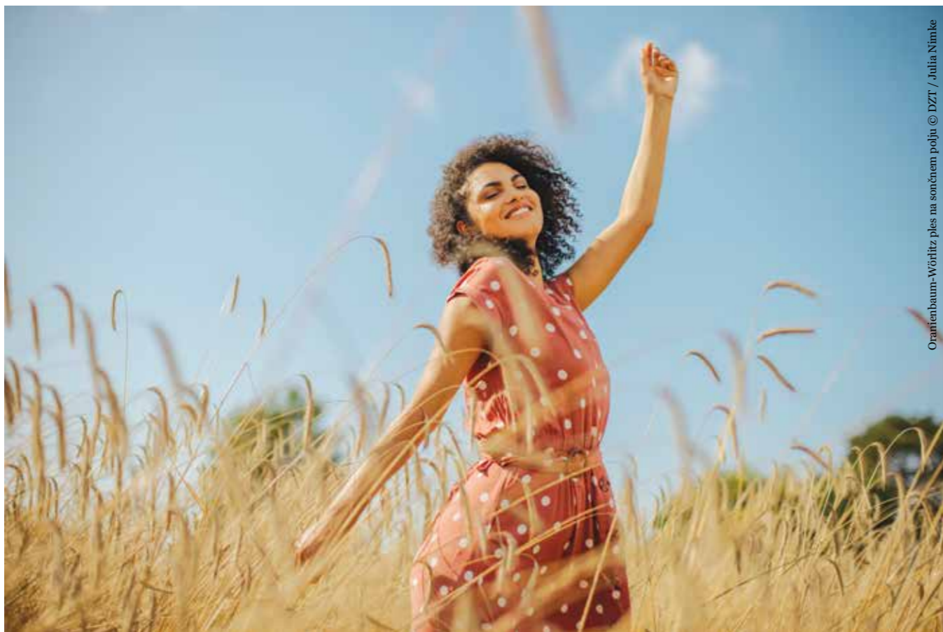
Oranienbaum-Wörflitz, ples na sončnem polju