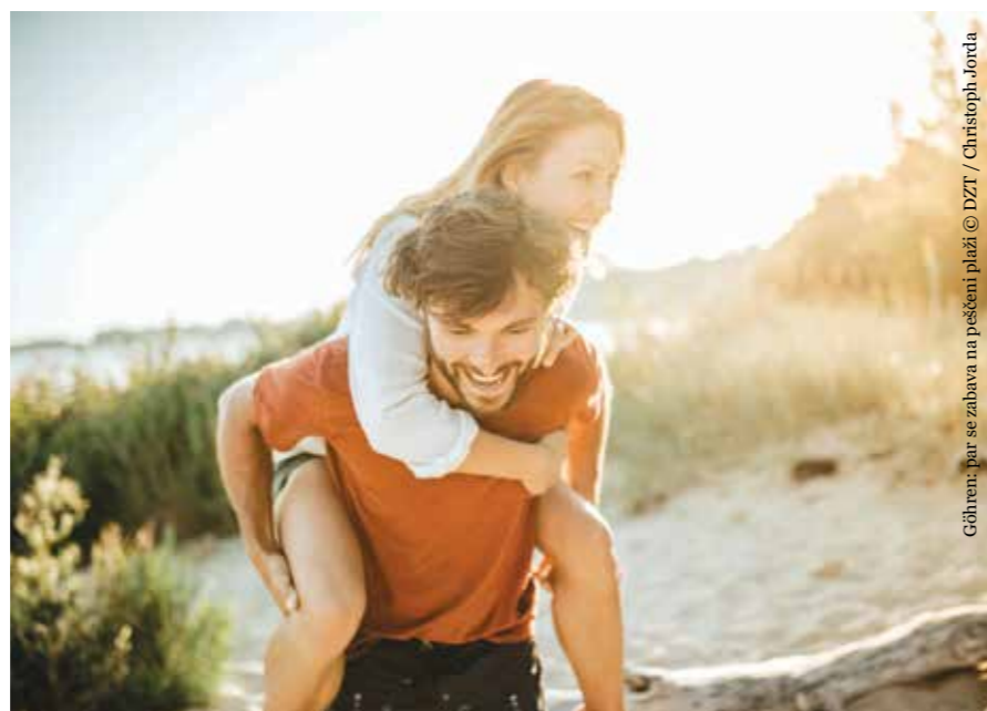
Gähren: par se zabava na peščeni plaži

Na Vzhodnih Frizijskih otokih ob Severnem morju pa dopustnike čaka povsem drugačna narava. Tudi tukaj so priljubljeni dolgi sprehodi po peščenih plažah z razgledom na odprto morje, obiščete pa lahko tudi edinstvene muljaste plitvine Waddenskega morja, ki spadajo med Unescovo svetovno dediščino. Na vodenih pohodih lahko spoznate to edinstveno obalno krajino z milijoni ptic seliv ter nepreštevni školkami srčankami in rakovicami.