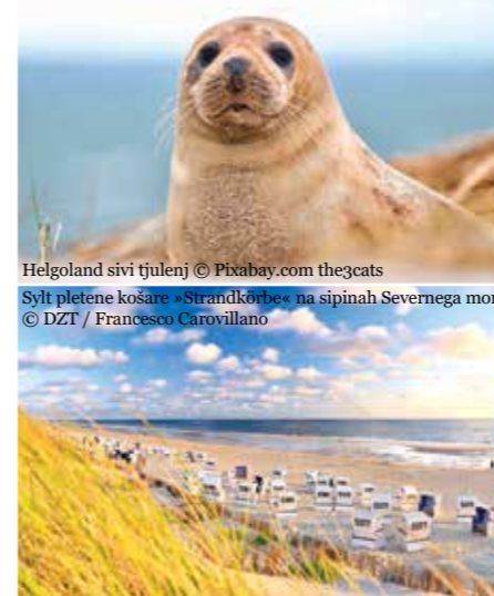
Helgoland sivi tjunelj Sylt pletene košare »Strandkörbe« na sipinah Severnega morja