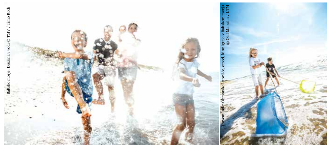
Baltsko morje: Družina v vodi