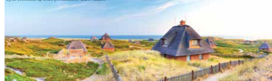
Sylt: Hörnum

Supported by: Federal Ministry for Economic Affairs and Climate Action on the basis of a decision by the German Bundestag