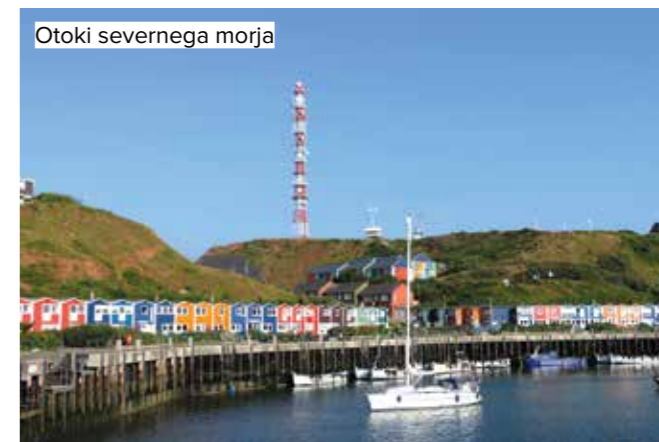
Otoki severnega morja

Prestolnica zvezne dežele Schleswig-Holstein privablja s številnimi muzeji, trgovinami in znamenitostmi. Vrhunec, ki ga prebivalci in gostje mesta čakajo vse leto, je seveda Kielov teden. Jadralska regata, ki poteka v juniju, je eden najpomembnejših dogodkov na področju jadrarstva in se zaključi z ognjemetom, znanim kot »Čarovnija zvezd nad Kielom«. Poleg tega lahko v Kielu najdete tudi idilične kraje: sprehodite se ob reki Kiellinie, sprostite se na plaži Falckensteiner ali se sprehodite po starem botaničnem vrtu. Laboe, ki se nahaja ob fjordu Kiel, je znan po svojih znamenitostih pomorskega značaja: pomorski spomenik sestavlja 85 metrov visoki stolp z razgledno ploščadjo, s katere lahko vidite vse do Danske. V podzemni dvorani so na ogled ladijski modeli in eksponati, povezani z zgodovino ladijskega prometa. V neposredni bližini stoji podmornica U 95, ki je bila predana v uporabo leta 1943.