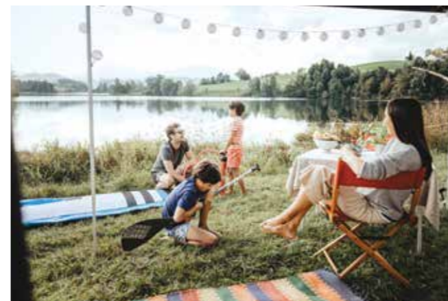
Družina s supom ob ribniku Schwaltenweiher (Allgäu)