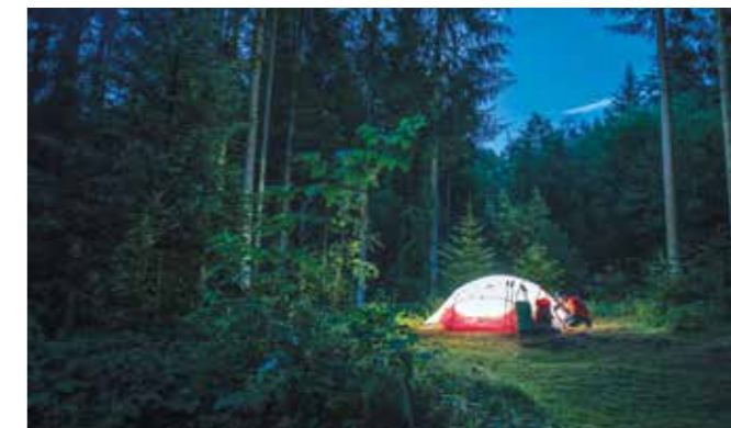
Zgornji Schwarzwald: divje kampiranje na pohodniški turi v gorah

Našteto je le en delček tega, kar ponuja Nemčija. Edinstvena narava govori sama zase, in če jo bomo skupaj varovali, jo bomo ohranili še za mnoge generacije. Poiščite svoj navdih, potem pa obiščite počitniško deželo Nemčijo in se prepričajte na lastne oči!