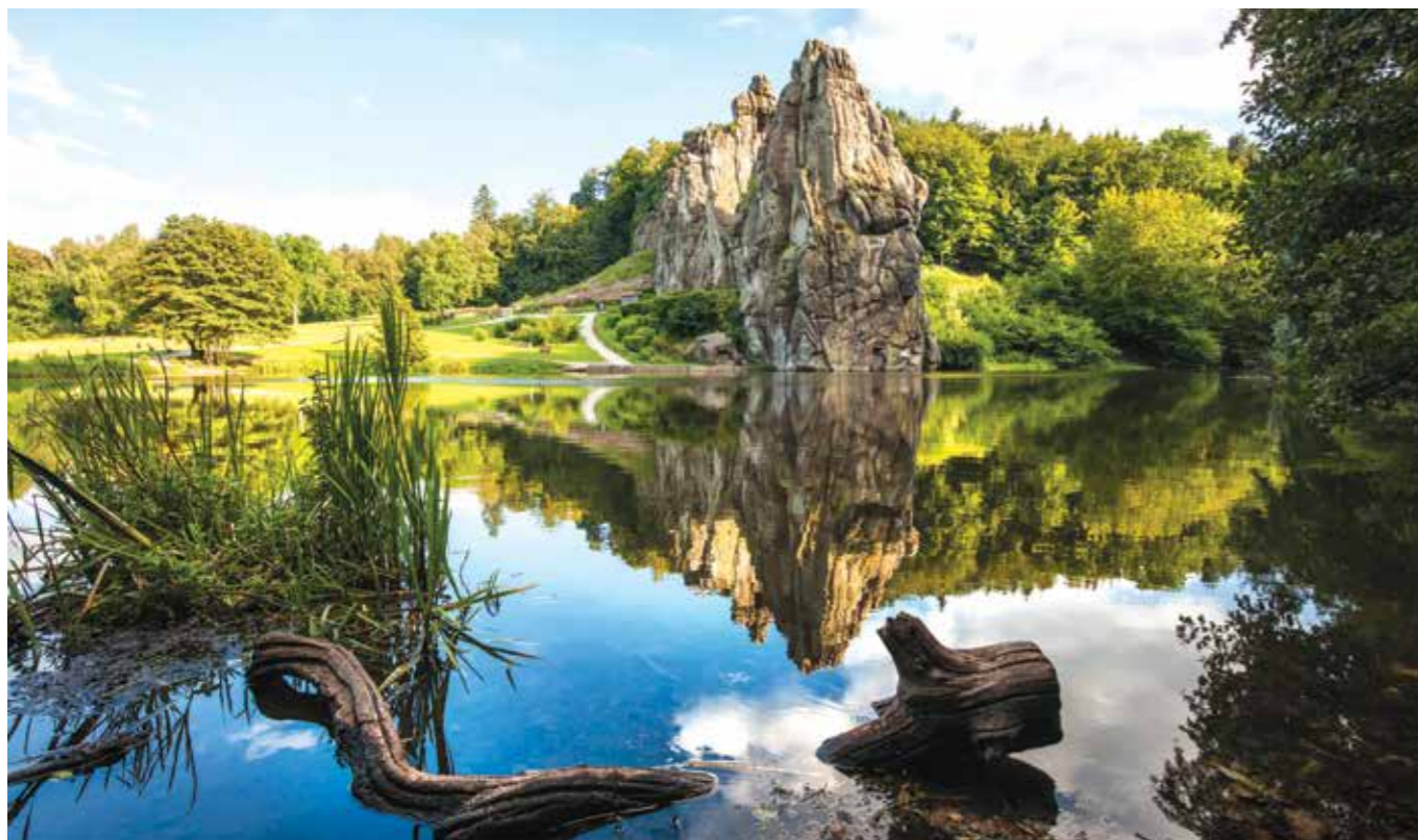
Nesselwang čas za počitek ob Schwaltenweiher (Allgäu)