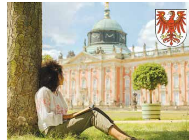
Vir: Potsdam grad Sanssouci © DZT / Julia Nimke