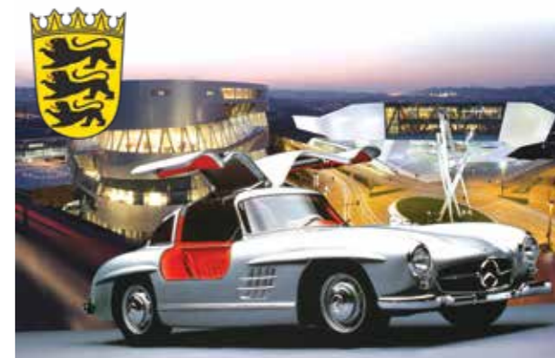
Vir: Stuttgart: Mercedes-Benz muzej v Untertürkheimu © Stuttgart-Marketing GmbH (SMG)