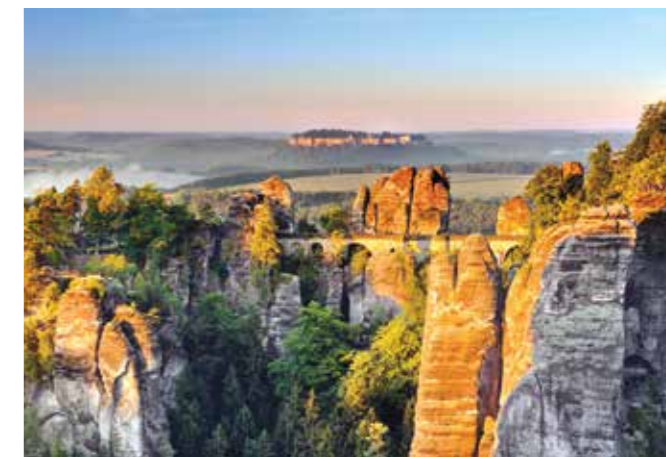
Lohmen: bastion in grad Königstein v narodnem parku Saška Švica