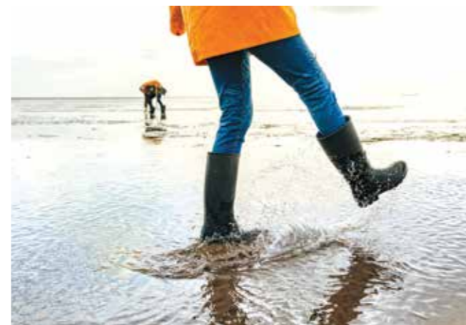
Dagebüll: obiskovalka in vodič po muljastih plitvinah na ogledu muljastih plitvin

Berlin ali Köln sicer ne prideta v poštev, saj so vlemesta in metropolitanska območja preveč svetlobno onesnažena. Kjer kraljujejo ulične svetilke, osvetljeni industrijski obrati, panonji in stanovanjska naselja, je pogled navzgor precej žalosten. Svetlobno onesnaženje danes prisotno že po vsem svetu in lahko celo škoduje zdravju. Zato je to tudi pomemben del trajnostnega razvoja.