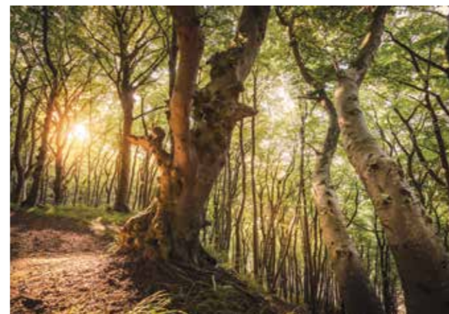
Sassnitz: stari nemški bukovi gozdovi, narodni park Jasmund, otok Rügen (Unescova svetovna dediščina)

Če si želite pristne izkušnje, preprosto zlezite v svojo spalno vrečo pod zvezdnatim nebom in si na plinskem gorilniku popecite klobasice. Če bi radi dopustovali bolj lagodno, pa se lahko razvajate v kampu s petimi zvezdicami ob večerji