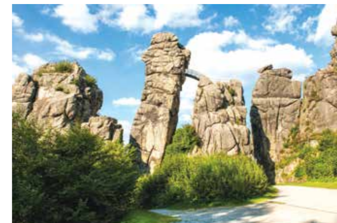
Horn-Bad Meinberg: Externsteine v Tevtoburškem gozdu

Kljub temu pa nikoli nismo prav daleč od primernege mesta za opazovanje zvezd. Eden najbolj priljubljenih krajev za opazovanje nočnega neba je Sternenpark Westhavelland, prvi zvezdni park v Nemčiji. Nemčija se zdaj ponaša že s štirimi območji temnega neba (Dark Sky). Od leta 2014 mednje spada tudi zvezdni park Rhön, ki leži v samem središču Nemčije, na tromeji med Bavarsko, Hessnom in Turingijo. Tam lahko opazujete spektakularne nebesne pojave, kot so utrinki in meteroidi, ter seveda zvezde in planete.